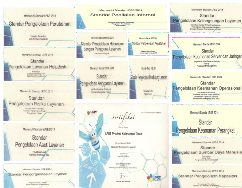
Gambar 3. 17 Standar Layanan Biro Pengadaan Barang dan Jasa Setda Prov. Kaltim

pengelolaan resiko layanan; standar pengelolaan layanan helpdesk; standar pengelolaan perubahan; standar pengelolaan kapasitas; standar pengelolaan sumber daya manusia; standar pengelolaan keamanan perangkat; standar pengelolaan keamanan operasional; standar pengelolaan keamanan server dan jaringan; standar pengelolaan kelangsungan layanan; standar pengelolaan anggaran layanan; standar pengelolaan pendukung layanan; standar pengelolaan hubungan dengan pengguna layanan; standar pengelolaan kepatuhan; serta standar penilaian internal.