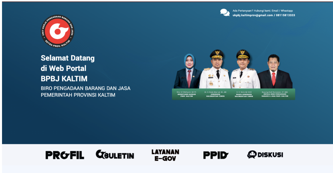
Gambar 7. web portal PPID Biro PBJ SetdaProv. Kaltim ( https://biropbj.kaltimprov.go.id )

Disamping itu dilakukan pula upaya penyegaran tampilan, serta konten pada sosial media seperti Instagram dan youtube.