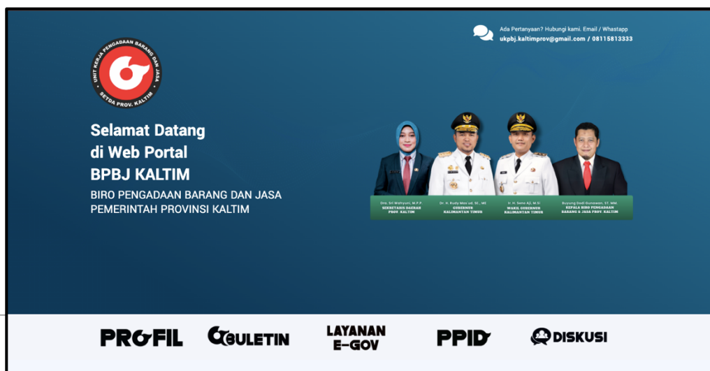
Gambar 2. Halaman Website resmi dan Website PPID Biro PBJ Setda Prov. Kaltim

Selain pelayanan langsung melalui meja layanan, PPID Pelaksana Biro PBJ Setda Prov. Kaltim juga menyediakan sarana sosialisasi dan dokumentasi informasi publik secara elektronik melalui website resmi Biro PBJ Setda Prov Kaltim https://biropbj.kaltimprov.go.id/ atau https://biropbj.kaltimprov.go.id/ppid#ppid guna memfasilitasi masyarakat dan pemangku kepentingan dalam memperoleh informasi yang dibutuhkan secara mudah, cepat, dan transparan.